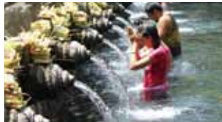
ティルタ・エンブル寺院